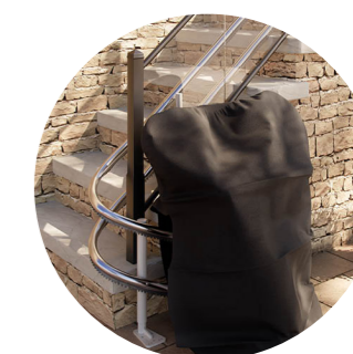
Kryt na sedačku