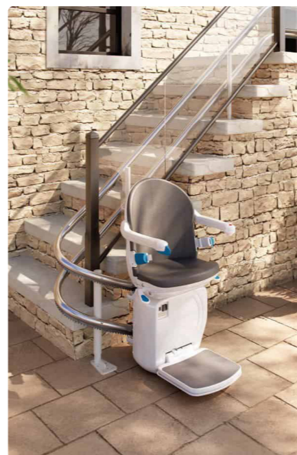
Perfektní design a kvalita za příznivou cenu