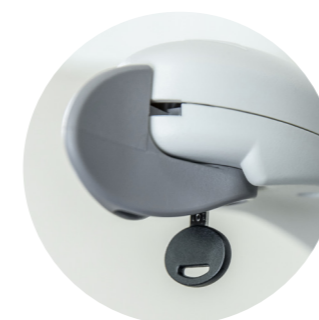
Ovládání na sedačce a zámek