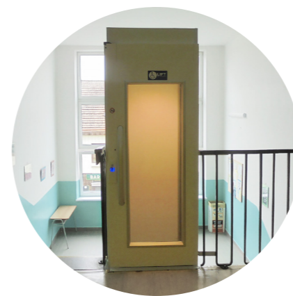
Výška zdvihu až 13 m / 6 stanic