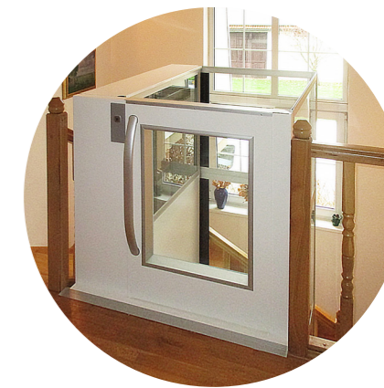
Minimální výška šachty v horní stanici