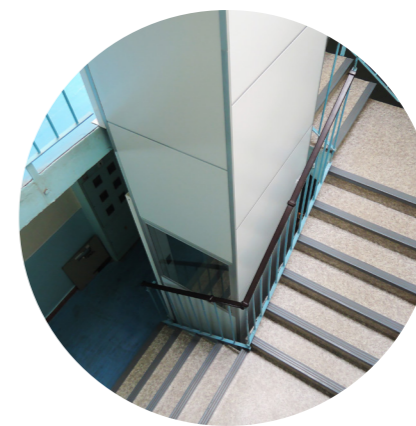
Minimální nároky na stavební úpravy