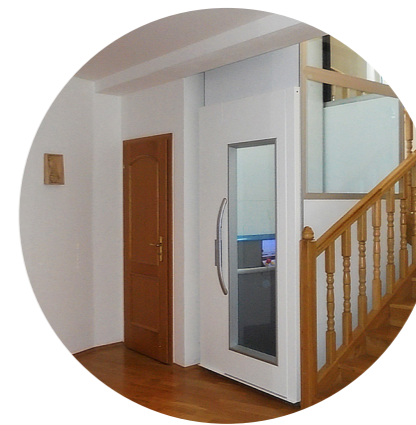
Možnost výběru dveří