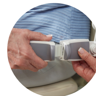
Samonavíjecí bezpečnostní pás