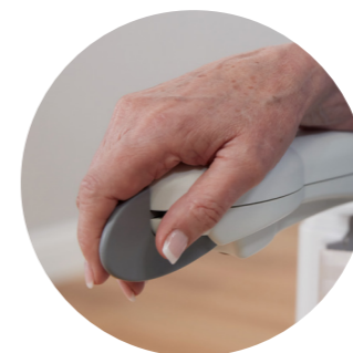
Ovládání na sedačce