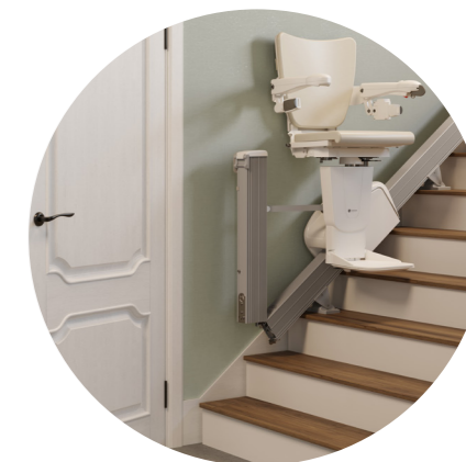
Automaticky sklopný dolní konec dráhy