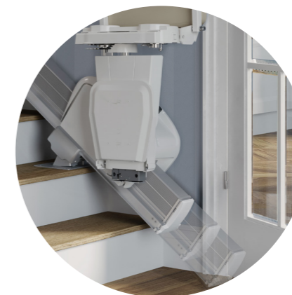
Automaticky výsuvný konec dráhy