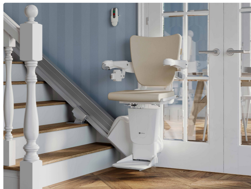
Maximální bezpečnost zařízení a uživatelský komfort